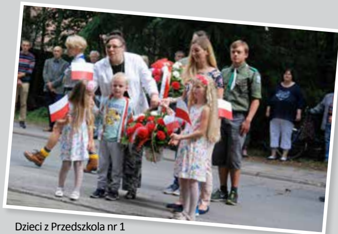
Dzieci z Przedszkola nr 1 „Pod dębowym listkiem” przed złożeniem kwiatów

Hołd poległym składają milanowscy harcerze