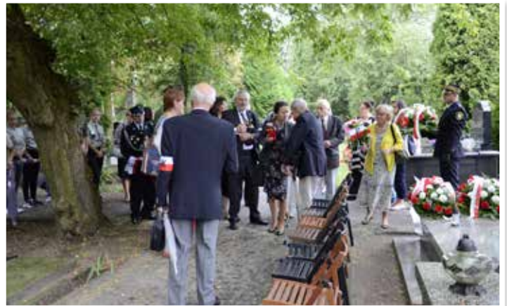
Przygotowania do uroczystości na cmentarzu