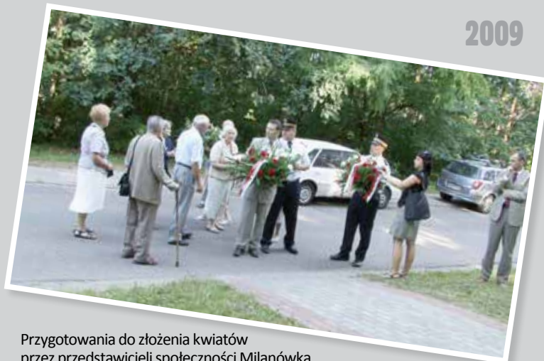
Przygotowania do złożenia kwiatów przez przedstawicieli społeczności Milanówka