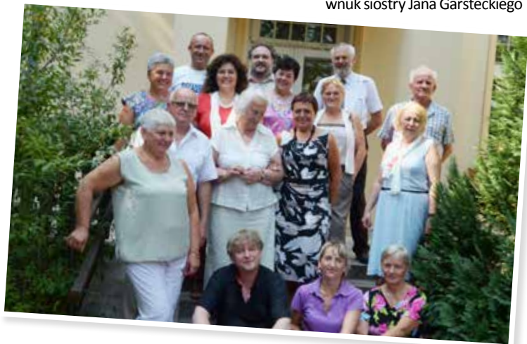
Na schodach willi „Księżanka” wraz z gośćmi z Sierakowa