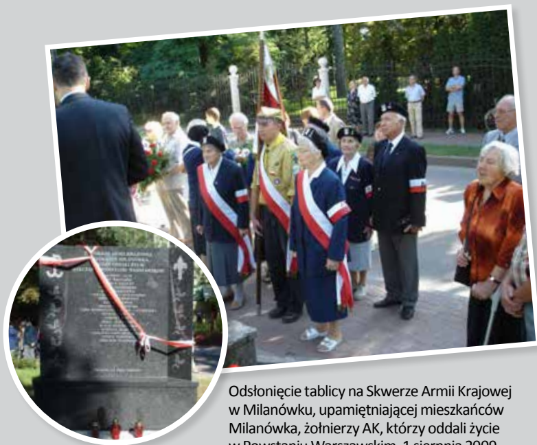
Odsłonięcie tablicy na Skwerze Armii Krajowej w Milanówku, upamiętniającej mieszkańców Milanówka, żołnierzy AK, którzy oddali życie w Powstaniu Warszawskim, 1 sierpnia 2009