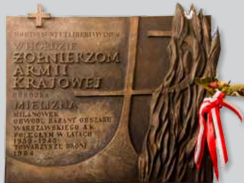
Tablica z kruchty kościoła pw. św. Jadwigi Śląskiej upamiętniająca wszystkich żołnierzy Ośrodka „Mielizna” Milanówek Obwodu „Bażant” Obszaru Warszawskiego AK poległych w latach 1939-1945