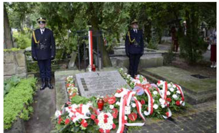
Warta honorowa przy grobie po uroczystości