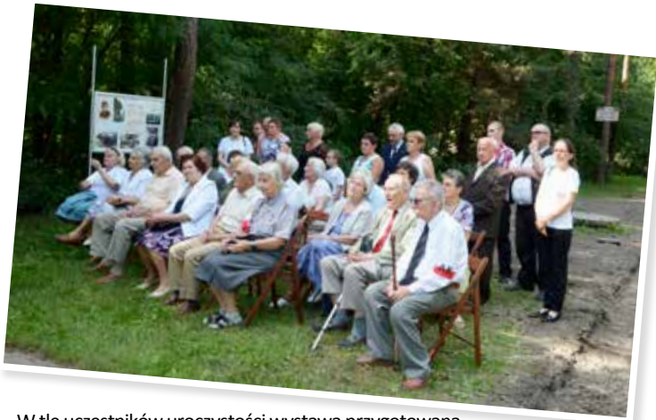
W tle uczestników uroczystości wystawa przygotowana przez Archiwum Dokumentacji Osobowej i Płacowej w Milanówku