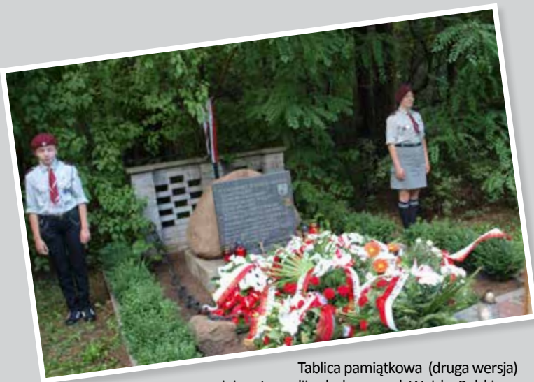
Tablica pamiątkowa (druga wersja) na miejscu tragedii w lasku przy ul. Wojska Polskiego