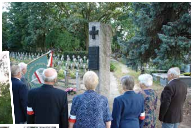
Oddanie hołdu uczestnikom Powstania Warszawskiego i ludności cywilnej Warszawy, zmarłym w wyniku ran i chorób w milanowskich szpitalach w okresie IX 1944-VII 1945, 1 września 2004