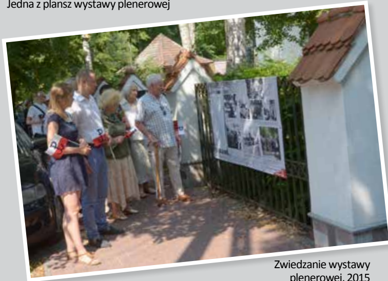
Zwiedzanie wystawy plenerowej, 2015