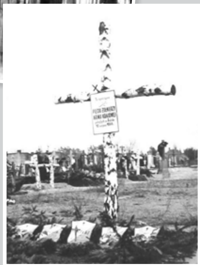
Pierwszy grób na cmentarzu parafialnym, 1945