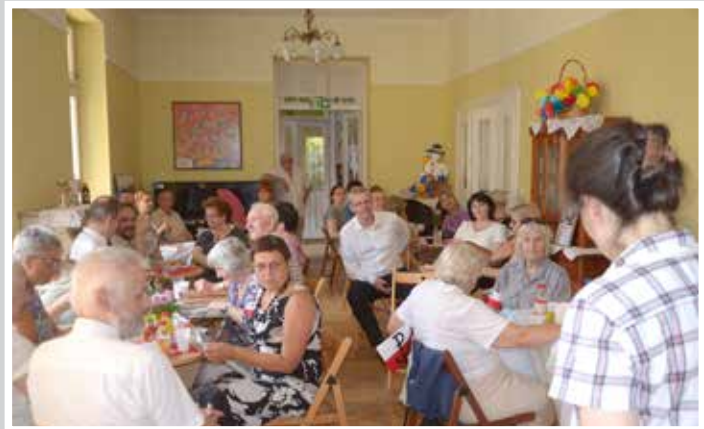
Wręczenie podziękowań dla współorganizatorów i sponsorów uroczystości