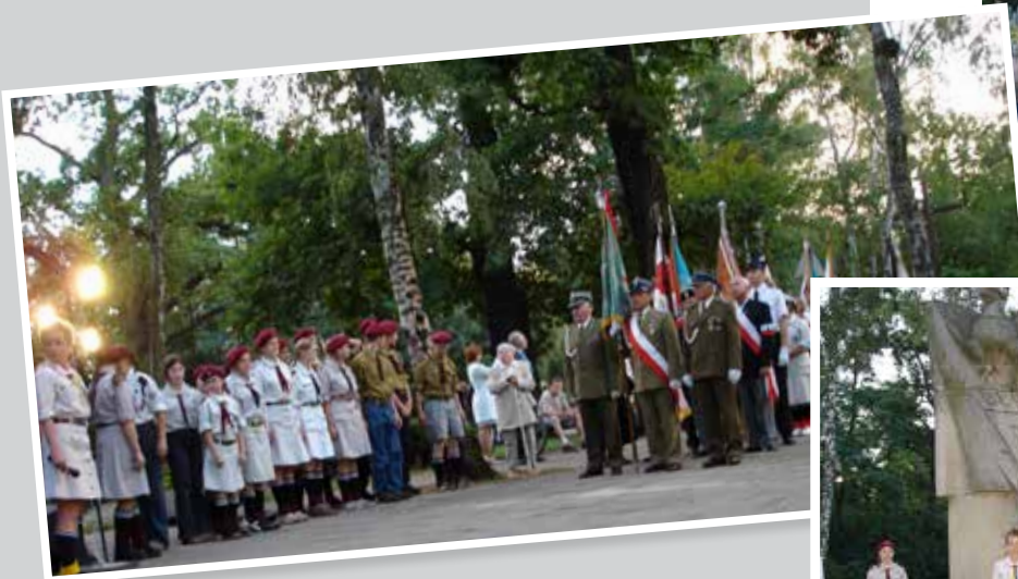
Uroczystość na Placu Stefana Starzyńskiego przy Pomniku Bohaterów w Milanówku w rocznicę wybuchu II wojny światowej, 1 września 2004