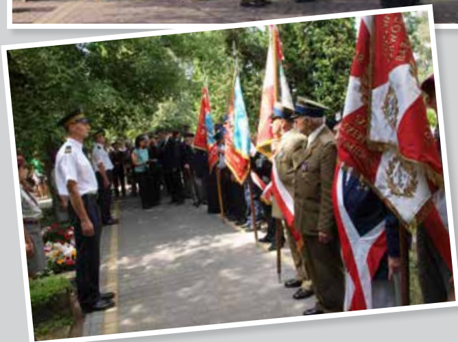
Poczty sztandarowe ŚZŻAK Środowisko „Mielizna”, Związku Kombatantów RP i Byłych Więźniów Politycznych Koło Milanówek, OSP Milanówek i OSP MIFAM-Milanówek