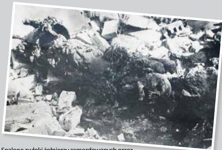
Spalone zwłoki żołnierzy zamordowanych przez Niemców – dowód zbrodni hitlerowskiej