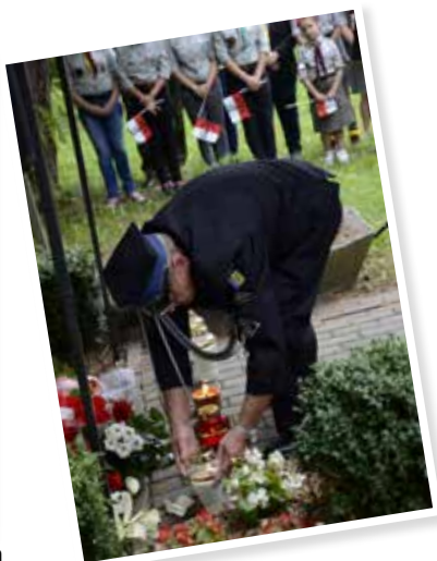
Znicz dla poległych od OSP Milanówek