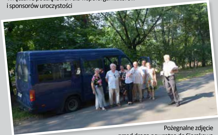
Pożegnalne zdjęcie przed drogą powrotną do Sierakowa