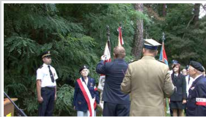
Odnaczenie sztandaru ŚZZAK Środowisko „Mielizna”