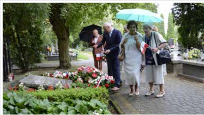
Tuż po uroczystości na cmentarzu