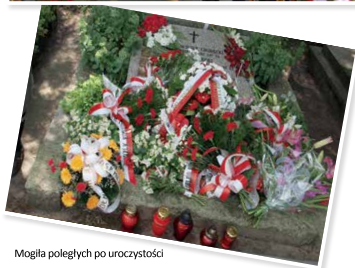
Mogiła poległych po uroczystości