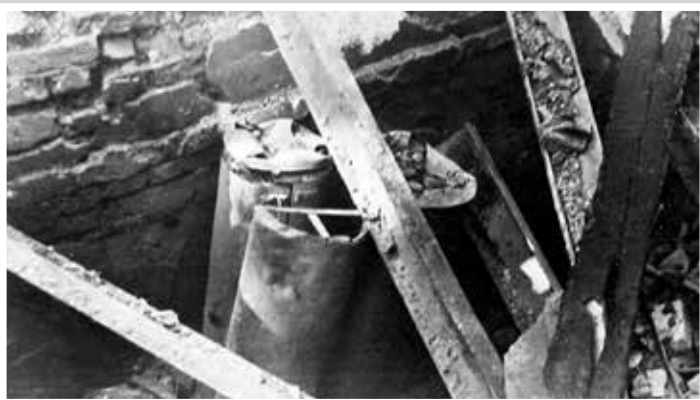
Pojemniki zrzutowe pozostałe w zniszczonym przez Niemców magazynie broni w „Lasku Pondra”, 10 sierpnia 1944 r.

Rezerwy Piechoty – Centrum Wyszkozenia Wojskowego Szarych Szeregów „Agrykola”, a później kursy podoficerskie w ramach powołanego Zastępczego Kursu Szkolenia Niższych Dowódców. Funkcjonowały tajne drukarnie i kolportaż prasy podziemnej, pracowały radiostacje nadawczo-odbiorcze, prowadzono nasłuchy radiowe.